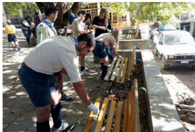
Εθελοντές από το Σώμα Ελλήνων Προσκόπων συμμετείχαν στην συντήρηση κοινόχρηστων χώρων στο χωριό Καλλιπεύκη.

MetLife Alico also financially supported the Scouts of Greece, who also offered voluntary service in Kalipefki village.